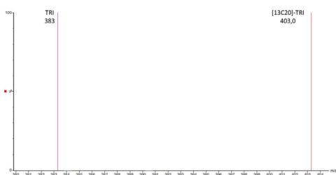
Spectre MS de la T2 Triol et étalon LIB'UP® U-[ ^{13}\text{C}20 ]-T2 Triol