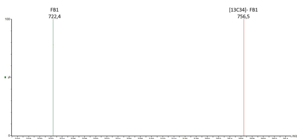
Spectre MS de la Fumonisine B1 et étalon LIB'UP® U-[ ^{13}\text{C} 34]-Fumonisine B1